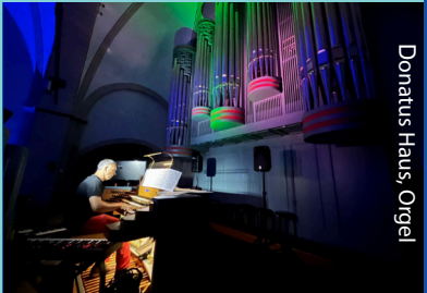
Donatus Haus, Orgel

Der Valentinstag wurde 469 als Gedenktag in der Kirche eingeführt. Der „Heilige der Herzen“ ist der Patron der Liebenden, Jugendlichen, Reisenden und Imker. Es gibt tatsächlich gregorianische Gesänge zum Valenstintag. Kombiniert mit Handy-Klingeltönen und Volksliedern ergründen